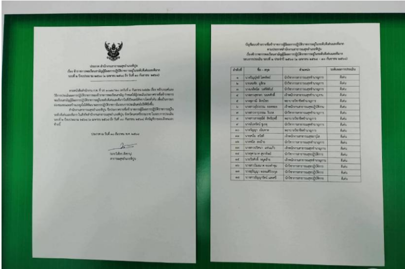
ประกาศฯ ข้าราชการ